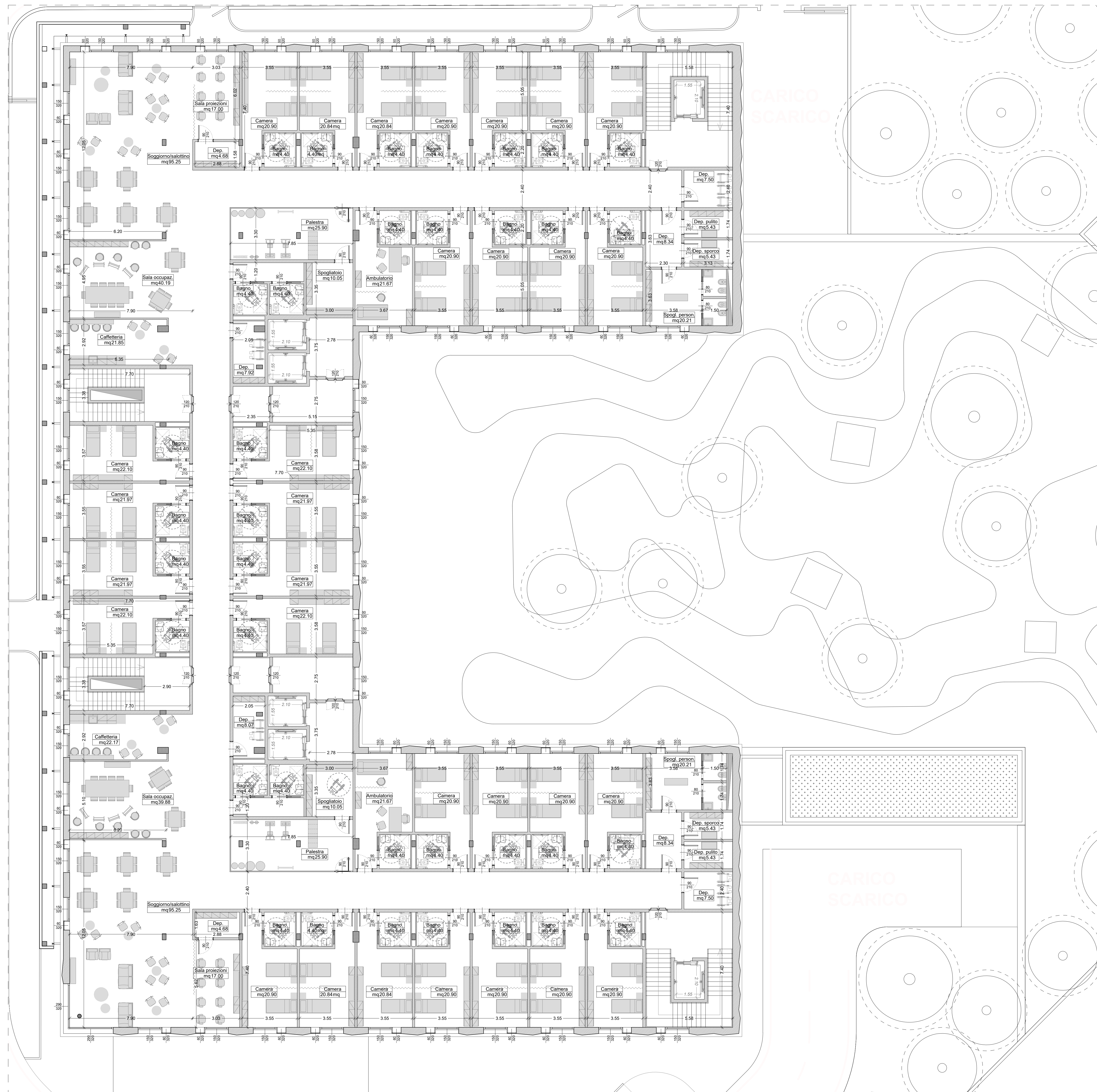
Pianta Piano tipo (P1-P2)