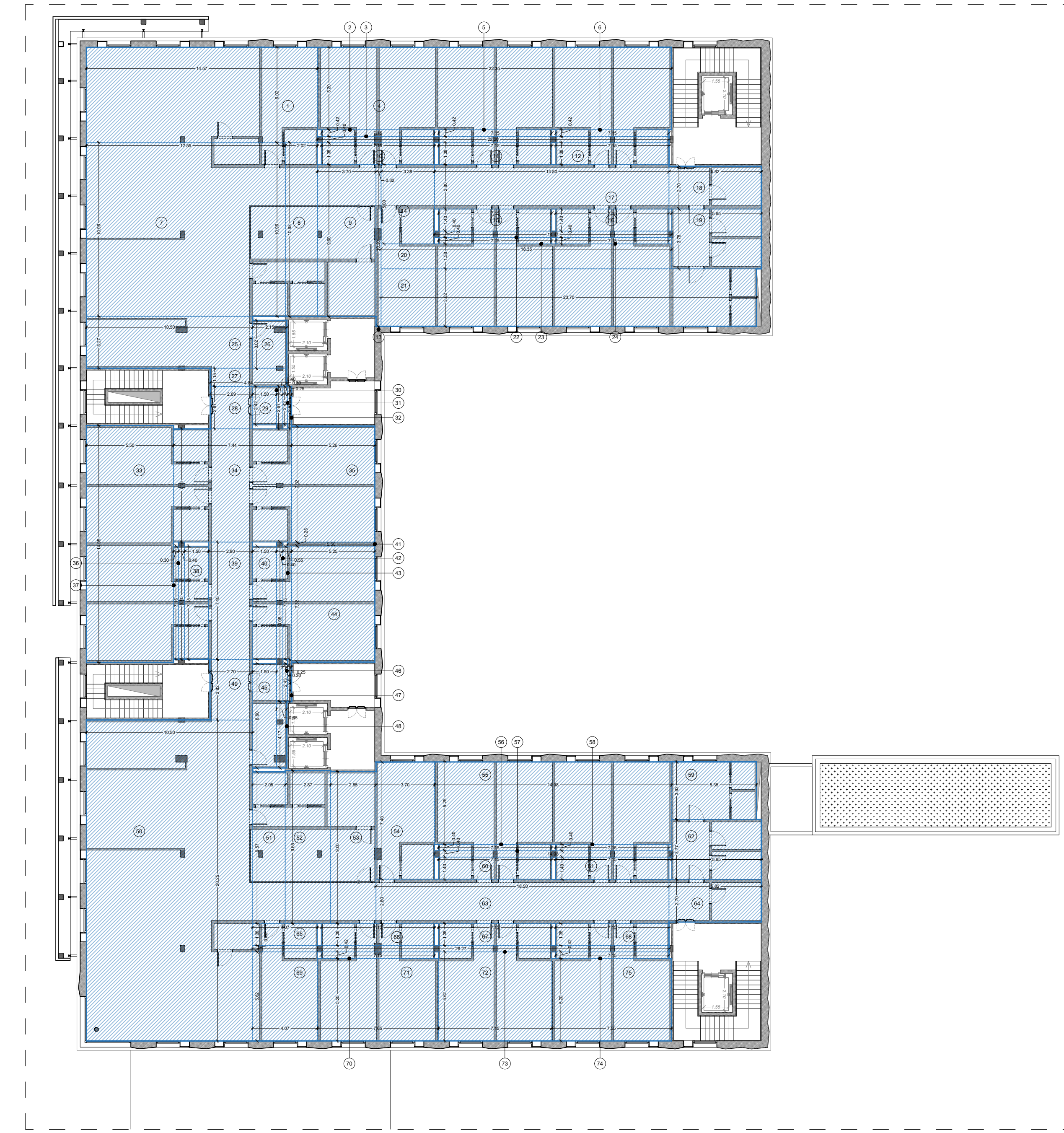
Pianta piano tipo (P1-P2) RSA