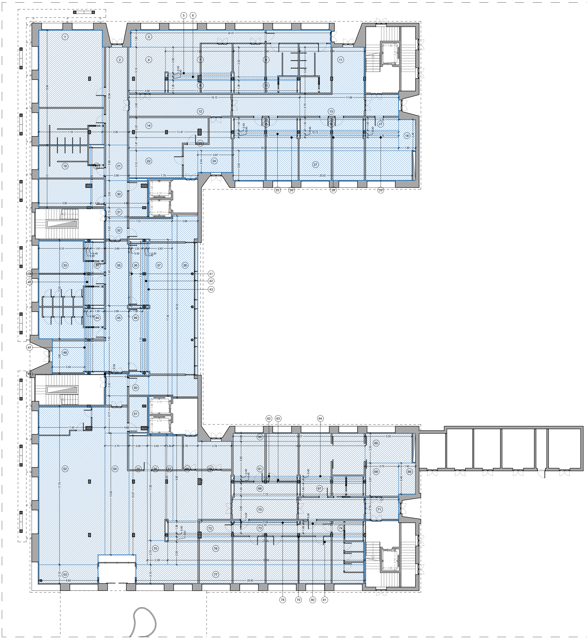
Pianta piano terra RSA