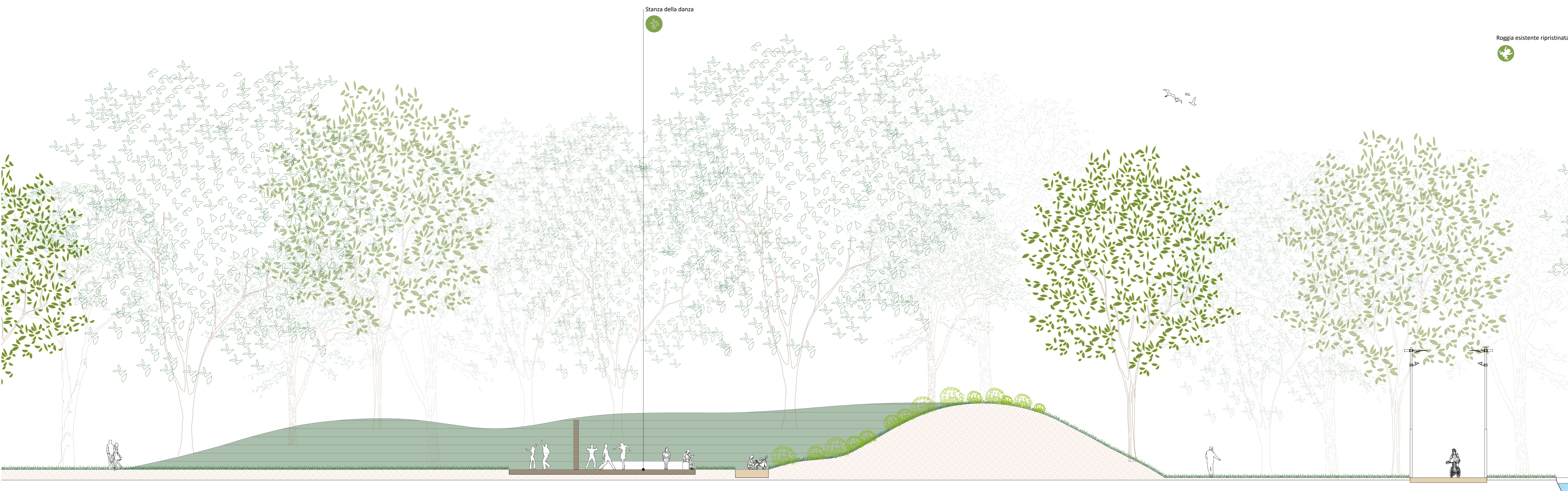
02 Sezione 1:100