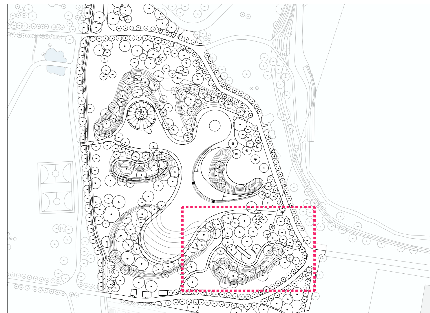
03 Kplan 1:2000