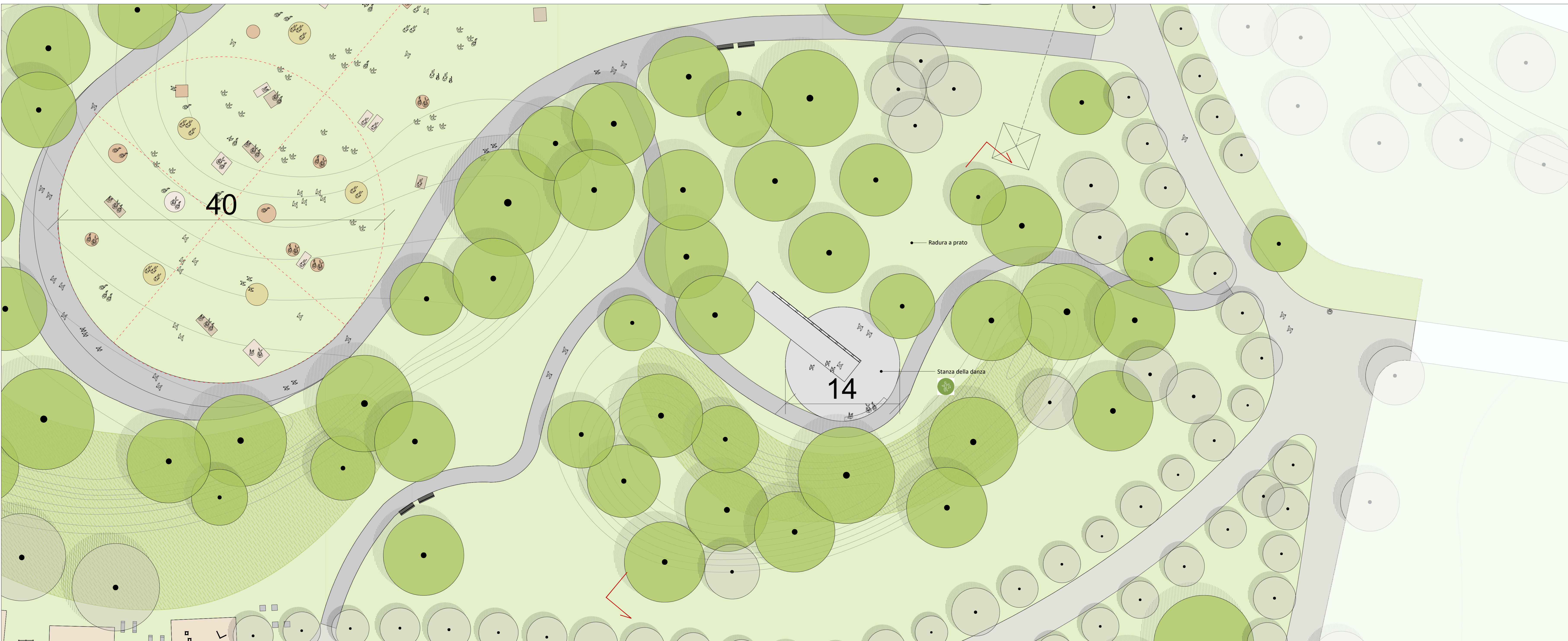
01 Focus planimetrico 1:200